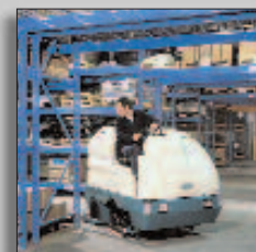
Machine in actie